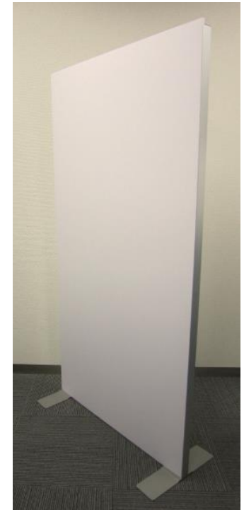
ボード貼り付け 使用例