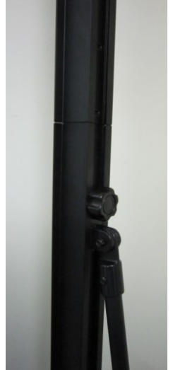
パーツ取り付け時

※ボードの貼り付けには、両面テープ・マジックテープなどをご用意下さい。本体に付属されていません。 ※貼り付けるボードの材質、厚み、サイズ、接着剤等は、ご使用時にご確認下さい。