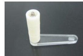
付属のバネ巻きハンドル